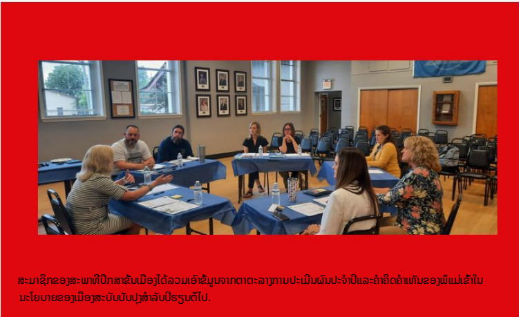
ສະມາຊິກຂອງສະພາທີ່ປຶກສາຂັ້ນເມືອງໄດ້ລວມເອົາຂໍ້ມູນຈາກຕາຕະລາງການປະເມີນຜົນປະຈຳປີແລະຄຳຄິດຄຳເຫັນຂອງພໍ່ແມ່ເຂົ້າໃນນະໂຍບາຍຂອງເມືອງສະບັບປັບປຸງສຳລັບປີຮຽນຕໍ່ໄປ.